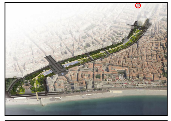
Repérage du Logement

IMMEUBLE APPARTEMENTS TYPE PREMIUM - Proche coulée verte