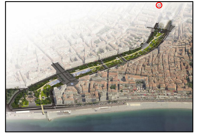
Repérage du Logement